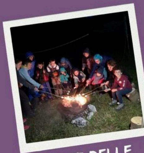
CAMP DELLE MAMME 3-5 luglio