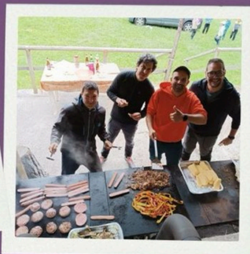
CAMP DEI PAPÀ 26-28 giugno 10-12 luglio