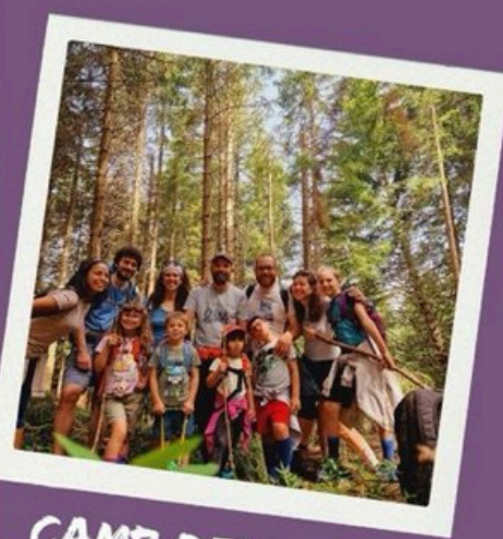
CAMP DELLE FAMIGLIE 7-9 agosto