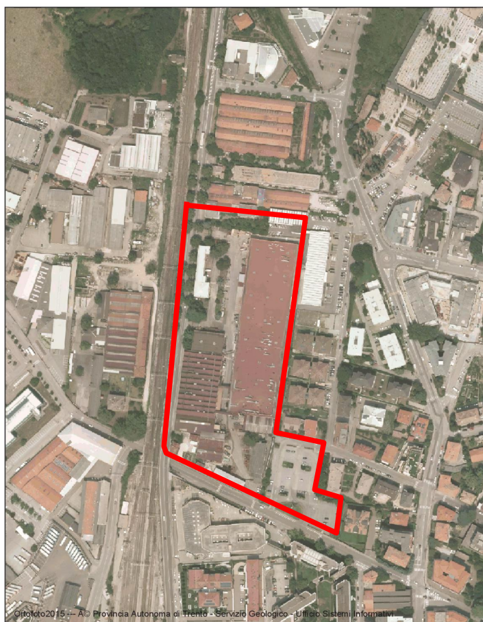
Figura 1: Area oggetto di variante al PRG - Situazione nel 2015

Il Protocollo di Intesa definisce quale localizzazione geografica del progetto il compendio immobiliare “Ex Ariston”, di proprietà di Trentino Sviluppo, e sito nel centro abitato cittadino, in una fascia “cuscinetto” tra una zona urbana consolidata con funzioni prevalentemente residenziali e connesse alla residenza ed importanti assi di connessione infrastrutturali quali la strada statale S.S. 12 e la ferrovia.